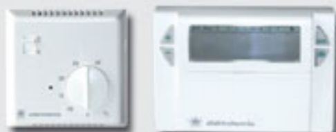
Regulator temperatury ELTE 25 616 - EK 051