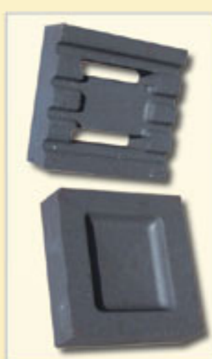
Bloki akumulacyjne (feolit)