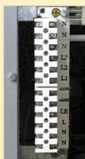
Czytelna listwa przyłączeniowa