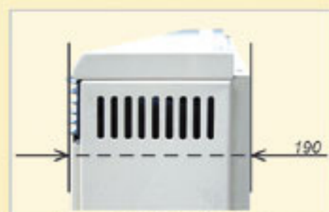
Szerokość tylko 19 cm