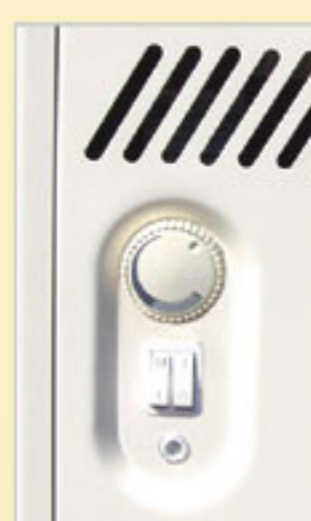
Panel z przełącznikami