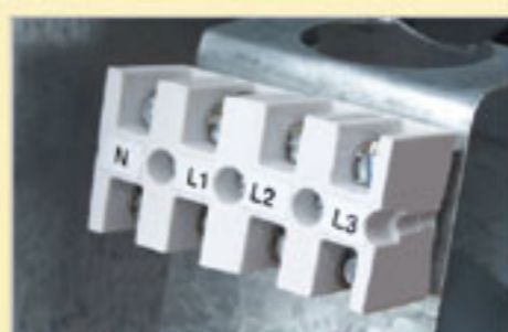
Czytelna listwa przyłączeniowa