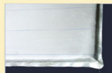
Izolacja cieplna - Microtherm