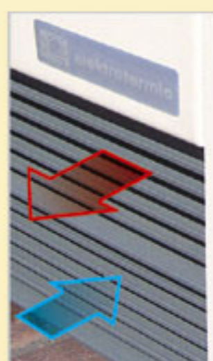
Kratka wlotowa i wylotowa